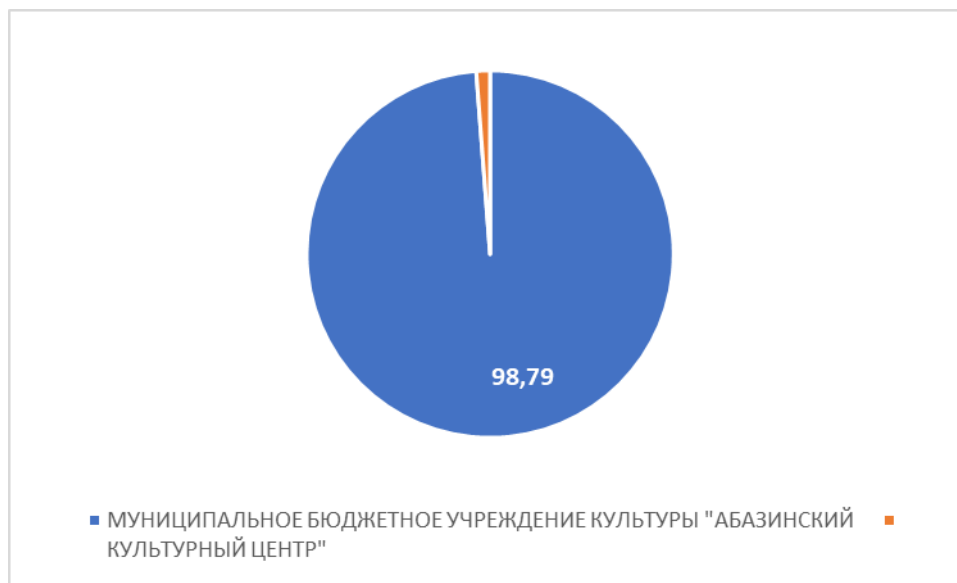
Рисунок 5 – Интегральный показатель по критерию «Удовлетворенность условиями оказания услуг»

По пятому критерию «Удовлетворенность условиями оказания услуг» МУНИЦИПАЛЬНОЕ БЮДЖЕТНОЕ УЧРЕЖДЕНИЕ КУЛЬТУРЫ "АБАЗИНСКИЙ КУЛЬТУРНЫЙ ЦЕНТР" набрало 98,79 балла (Рис.5).