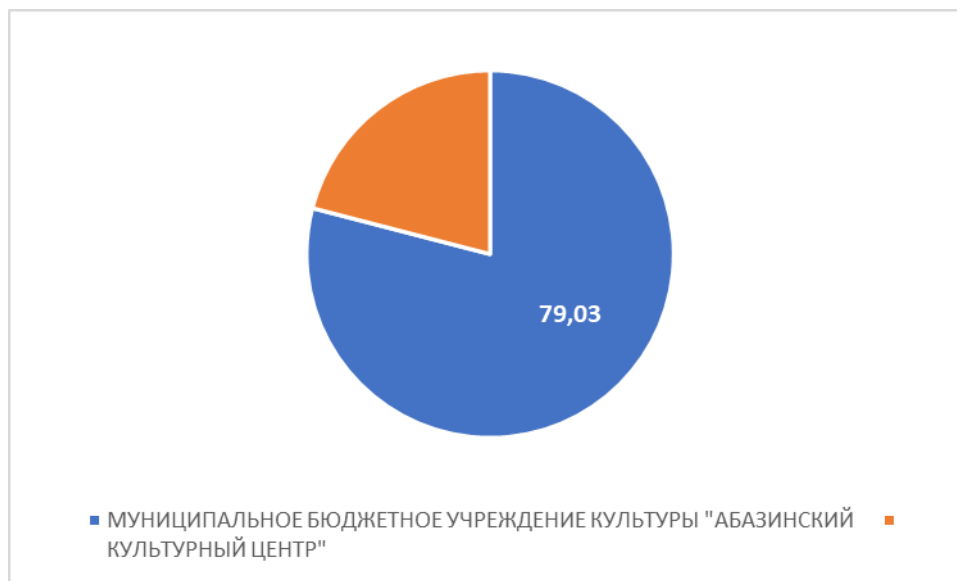
Рисунок 1 – Интегральный показатель по критерию «Открытость и доступность информации об организации культуры»

По первому критерию «Открытость и доступность информации об организации культуры» МУНИЦИПАЛЬНОЕ БЮДЖЕТНОЕ УЧРЕЖДЕНИЕ КУЛЬТУРЫ "АБАЗИНСКИЙ КУЛЬТУРНЫЙ ЦЕНТР" набрало 79,03 балла (Рис.1).