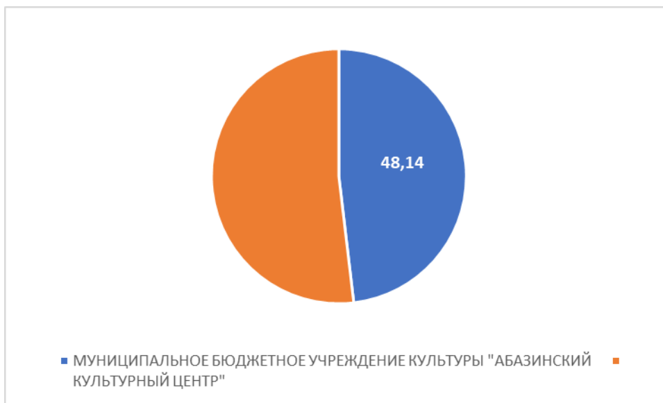
Рисунок 3 – Интегральный показатель по критерию «Доступность услуг для инвалидов»

По третьему критерию «Доступность услуг для инвалидов» МУНИЦИПАЛЬНОЕ БЮДЖЕТНОЕ УЧРЕЖДЕНИЕ КУЛЬТУРЫ "АБАЗИНСКИЙ КУЛЬТУРНЫЙ ЦЕНТР" набрало 48,14 балла (Рис.3).